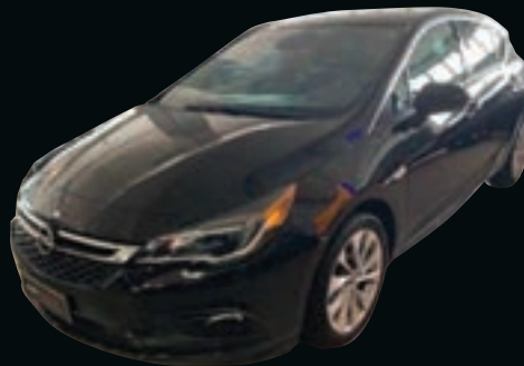
OPEL ASTRA 1.6 CDTI 136CV AUT. 5 PORTE INNOVATION DA € 13.950