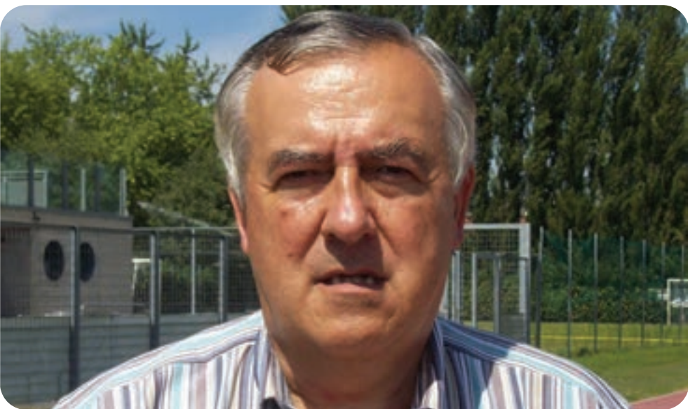
di Mattia Amaduzzi

"Ero contrario al 100%. Tra l'altro io sono juventino anche se non un fanatico, però condanno la società e Agnelli. La Superlega non poteva e non può far fallire la Champions. La Fifa ha fatto bene e sono d'accordo con la Federazione Italiana, se la Juventus non rinuncia non si può iscrivere. Chiaramente le difficoltà economiche ci sono, ma sono figlie di una cattiva gestione anche prima dell'emergenza Covid".