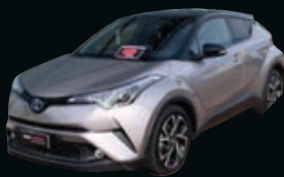
TOYOTA C-HR 1.8 HYBRID CVT STYLE DA € 17.950