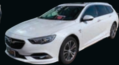
OPEL INSIGNIA 2.0 CDTI START&STOP AUT. SPORTS TOURER DA € 18.950

ALD select è il servizio ALD che seleziona per la vendita i migliori veicoli usati provenienti dal noleggio a lungo termine. Ti forniamo la garanzia di scegliere l'usato migliore perché teniamo sotto controllo lo storico dei nostri mezzi per selezionare accuratamente solo quelli più sicuri e certificati.