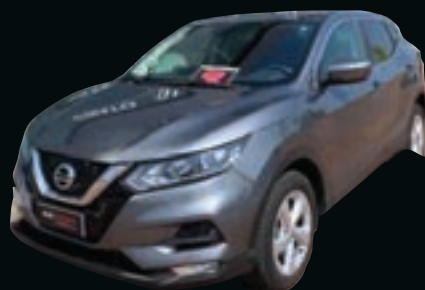
NISSAN QASHQAI 1.6 DCI 2WD BUSINESS DA € 18.950