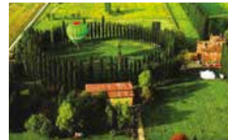
'Le radici e le ali' il 2 giugno pag. 14