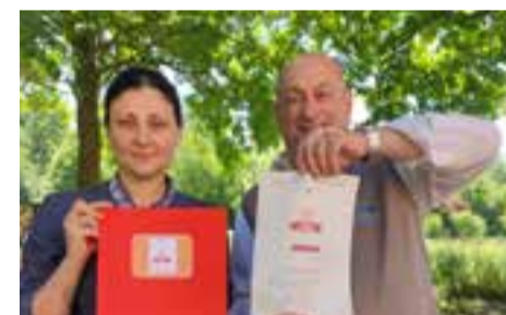
Nonantola, marchio De.CO pag. 15