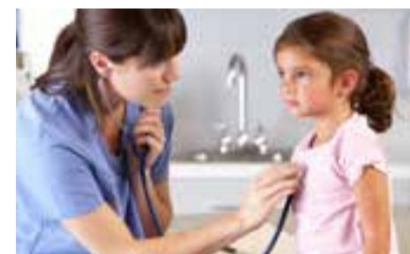
Pediatre a San Cesario pag. 15