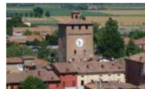
Nonantola ad aprile pag. 16