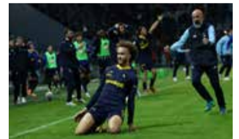
Modena, arriva il Frosinone pag. 19