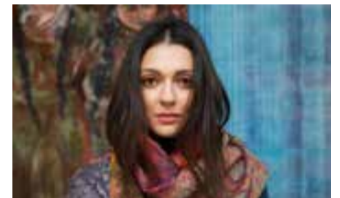
L'Altro Suono al Comunale pag. 8