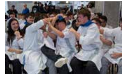
Spallanzani al Cooking Quiz pag. 12

Torna il 18 e il 19 aprile, un evento classico del periodo | A pagina 13