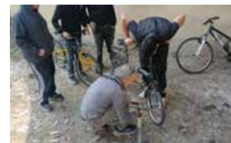
San Cesario e laboratori pag. 14