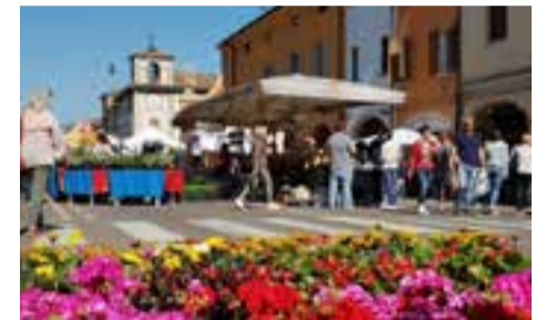
Insero Vivo Castelfranco pag. 11