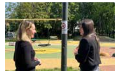
Notizie da Formigine pag. 16