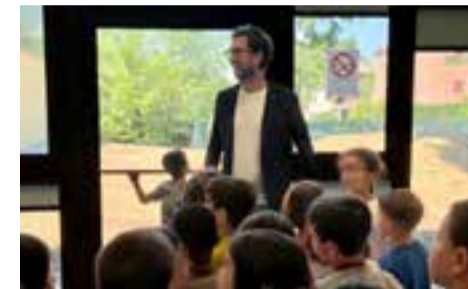
Visite al polo S. Agostino pag. 12

A Fiorano un'edizione speciale della kermesse di primavera | A pagina 14