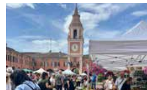
La primavera di Sassuolo pag. 13